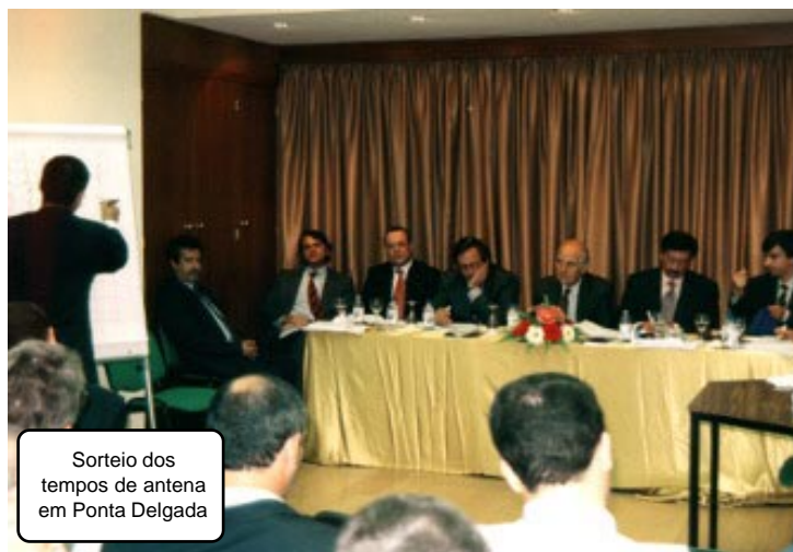
Sorteio dos tempos de antena em Ponta Delgada

A deslocação decorreu entre 16 e 23 de Setembro, tendo a Comissão visitado A. Heroísmo, Horta, P. Delgada e Funchal.